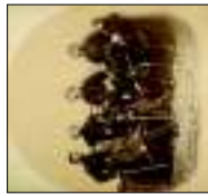
Boia di Ufficiali dell'Unione durante la Guerra Civile Americana , olio su tela, 1860. Inv. Museo di Firenze. € 2.000,00