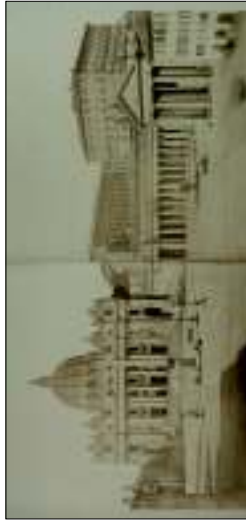
Tommaso Cavallotti - San Pietro , olio su tela, 1860. Inv. Museo di Firenze. € 1.800,00