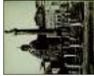
Grande foto del Foro Traiano a Roma , olio su tela, 1860. Inv. Museo di Firenze. € 2.000,00