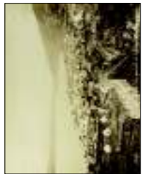
Paolo Bonaiuti , olio su tela, 1860. Inv. Museo di Firenze. € 1.800,00