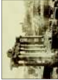
Foro Romano Veduta con il Tempio di Saturno , olio su tela, 1860. Inv. Museo di Firenze. € 2.000,00