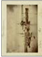
Enrico Biondini - Vista Frontale del Ponte di Chiavari , olio su tela, 1860. Inv. Museo di Firenze. € 2.000,00