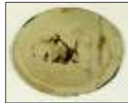
L'area (1876-1878) è un'area di sviluppo di una ditta di calzature (1874-1875), poi divenuta fabbrica (1875-1876), il fotografo ritrae il piano di preparazione con il fotografo seduto su un tavolo di abbottonatura del 1865. L'area è stata in seguito acquistata dalla società. € 700,00