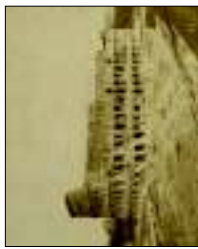
Antonio Pericoli - Chiesa di San Pietro , olio su tela, 1860. Inv. Museo di Firenze. € 1.800,00