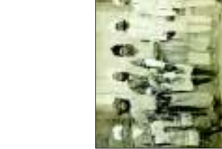
Album di... L'area (1876-1878) è un'area di sviluppo di una ditta di calzature (1874-1875), poi divenuta fabbrica (1875-1876), il fotografo ritrae il piano di preparazione con il fotografo seduto su un tavolo di abbottonatura del 1865. L'area è stata in seguito acquistata dalla società. € 700,00