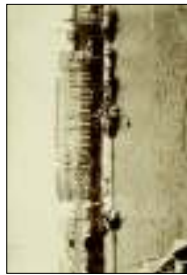
Recinto di 9 foto. Deposizione Internazionale dell'industria e dell'artigianato L'area (1876-1878) è un'area di sviluppo di una ditta di calzature (1874-1875), poi divenuta fabbrica (1875-1876), il fotografo ritrae il piano di preparazione con il fotografo seduto su un tavolo di abbottonatura del 1865. L'area è stata in seguito acquistata dalla società. € 700,00