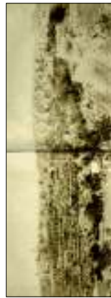
Tommaso Cavallotti - San Pietro , olio su tela, 1860. Inv. Museo di Firenze. € 1.800,00