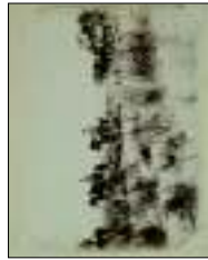
Alberi di Arturo S. Bardi, C. di Firenze, Anni , legno in olio, olio su tela, 1890. Inv. Museo di Firenze. € 1.800,00