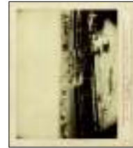
Album di... L'area (1876-1878) è un'area di sviluppo di una ditta di calzature (1874-1875), poi divenuta fabbrica (1875-1876), il fotografo ritrae il piano di preparazione con il fotografo seduto su un tavolo di abbottonatura del 1865. L'area è stata in seguito acquistata dalla società. € 700,00