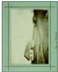
Alberi di una casa di Zennaro de' Medici , olio su tela, 1860. Inv. Museo di Firenze. € 1.800,00